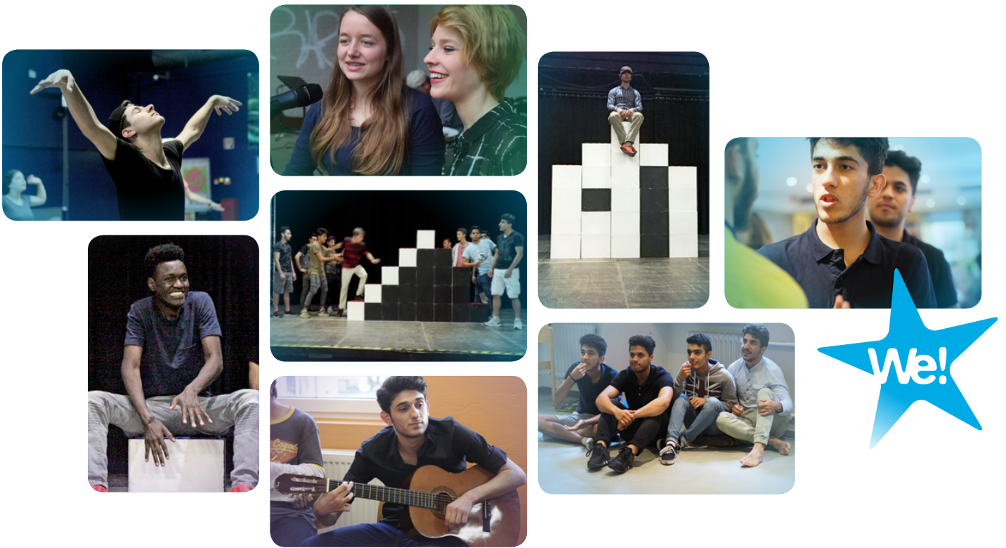
Fotos in höherer Auflösung und andere Motive auf Anfrage.

We perform ist eine Produktion der COBRA Kulturzentrum gGmbH, Anja Stock, a.stock@cobra-solingen.de, 01635571477 Projektleitung: Gloria Göllmann, gloriagoellmann@online.de, 01573 5472898 Öffentlichkeitsarbeit: Inge Heyen, ingehyen@ingehyen.de, 0179 4592233 Weitere Infos auf www.ingehyen.de/k045.htm